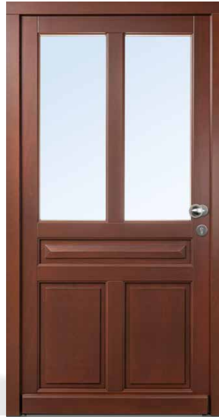
AH 94429 • Holzart Kiefer • Lasur Nussbaum 628