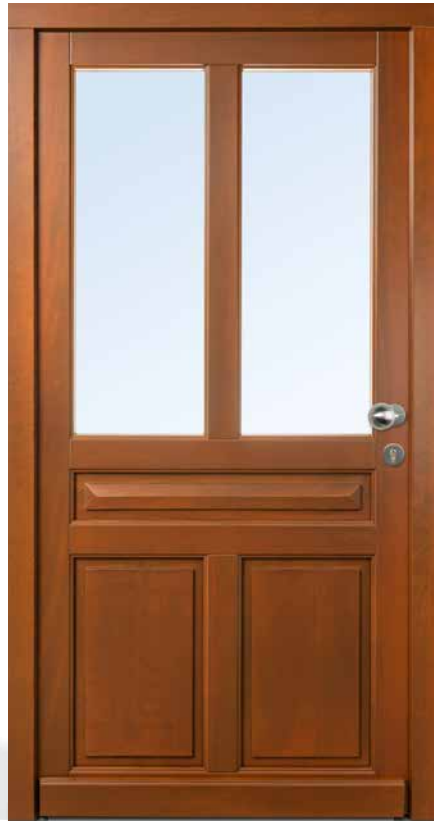
AH 94429 • Rahmenkonstruktion • Holzart Kiefer • Lasur Afrormosia 625 • Karniesprofil am Flügel • glasteilende Sprosse 98 mm • oben Glasfelder • unten Brüstungsplatten als Einsatzfüllung mit Zierprofil bzw. flacher Kassette außen • mit Holzwetterschenkel • S2150 Edelstahl-Knauf

Wenn sie von PaX kommen, dann machen die handwerkliche Qualität und das edle Design Holztüren zu etwas Besonderem.