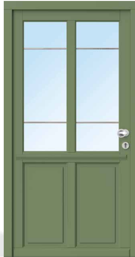
AH 94309 • Rahmenkonstruktion • Holzart Kiefer • Resedagrün RAL 6011 • Karniesprofil am Flügel • eine waagerechte glasteilende Sprosse 98 mm • senkrechte glasteilende Sprosse 78 mm • oben Glasfelder mit Bleisprossen 12 mm glatt • unten Brüstungsplatten als Einsatzfüllung, außen mit flacher Kassette, Zierprofil außen • mit Holzwetterschenkel • S2150 Edelstahl-Knauf