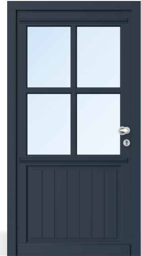
AH 94419 • Rahmenkonstruktion • Holzart Kiefer • Stahlblau RAL 5011 • Karniesprofil am Flügel • Aufbauprofil 40 mm oben • eine waagerechte glasteilende Sprosse 98 mm • oben Glasfeld mit 54 mm glasteilendem Sprossenkreuz • unten Brüstungsplatte als Einsatzfüllung • außen senkrecht genutet • zwei Zierprofile außen • mit Holzwetterschenkel • S2150 Edelstahl-Knauf