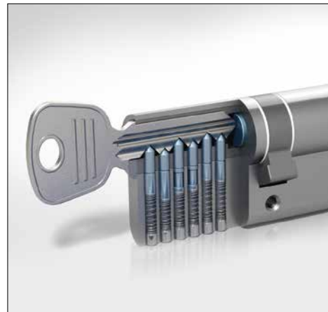
Profilzylinder mit Not- und Gefahrenfunktion

* Alle Preise in dieser Broschüre verstehen sich inklusive Mehrwertsteuer, zzgl. Fahrt- und Montagekosten. Das Aktionsangebot gilt bis zum 31.12.2025. Technische und preisliche Änderungen vorbehalten.