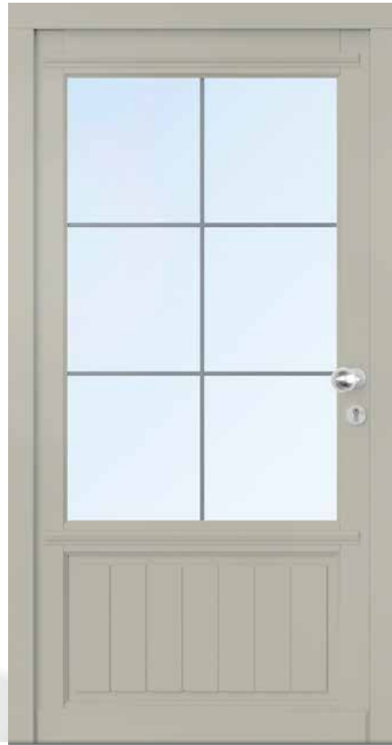
AH 94116 • Holzart Kiefer • Seidengrau RAL 7044