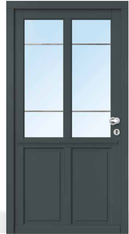
AH 94309 • Holzart Kiefer • Basaltgrau RAL 7012