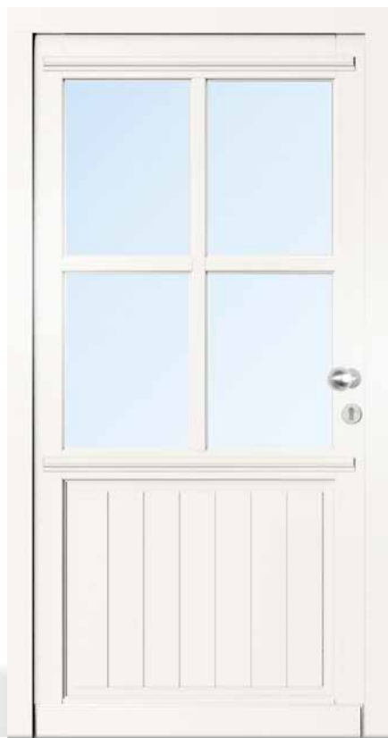
AH 94419 • Holzart Kiefer • Verkehrsweiß RAL 9016