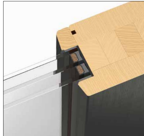
3-fach-Wärmeschutzglas U_g 0,7 W/(m 2 K)